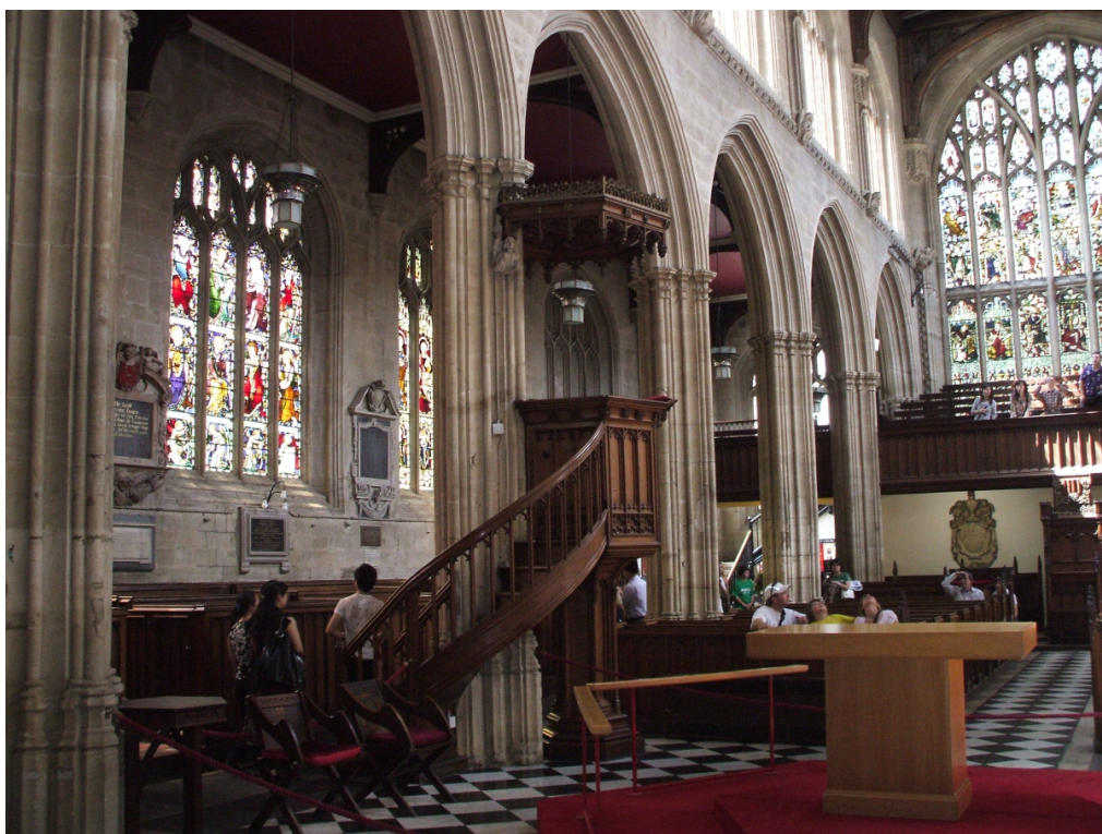
Púlpito de la Iglesia Universitaria de St. Mary's en Oxford. Como clérigo anglicano Newman predicó desde aquí los sermones parroquiales y los sermones universitarios

porque su ánimo va en esa dirección única y se explaya obedeciendo a Dios, de forma espontánea y sin deliberación o consideración, de la misma manera que el hombre peca de forma natural.