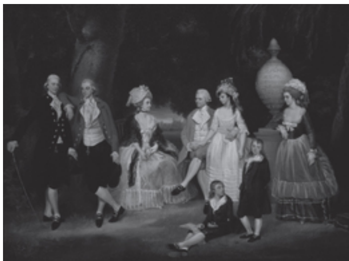
Retrato de la familia Fourdrinier: la mamá de Newman es la tercera desde la derecha (John Downman, 1786)

usar cualquier medio honesto a su alcance para elevarse y elevar la condición social de su familia. En 1799, gracias a su intenso trabajo se convirtió en socio de la firma comercial que a partir de ese momento sería Harrison, Pricket and Newman 8 . Su ascenso en la escala social llegaría a una posición muy favorecida en 1812 mediante la creación del banco Ramsbotton, Newman and Ramsbotton 9 , ubicado en la que antes había sido la residencia