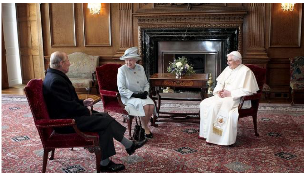
El Santo Padre Benedicto XVI en la audiencia con Su Majestad la Reina Isabel II en el Palacio de Holyroodhouse, durante la Visita Apostólica a Reino Unido con motivo de la Beatificación del Cardenal John Henry Newman (16-19 de septiembre de 2010). En la foto aparece también el esposo de la Reina, el Duque Felipe de Edimburgo.