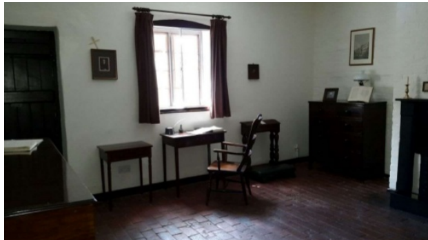
Habitación de Newman en Littlemore (Maryvale)

mismo había usado hacia él- y también la labor educativa que siempre había intentado realizar el que se definía a sí mismo, ante todo, como un "educador" 29 . Para Newman, la educación es cuestión de corazones, y ha de procurar un desarrollo integral del hombre, desarrollo de su capacidad de amar -de su corazón- y de su libertad: la autentica educación es una formación ordenada al uso correcto de la libertad que encuentra su plenitud en la donación personal, pues el hombre solo se realiza en la entrega sincera de sí a los demás 30 .