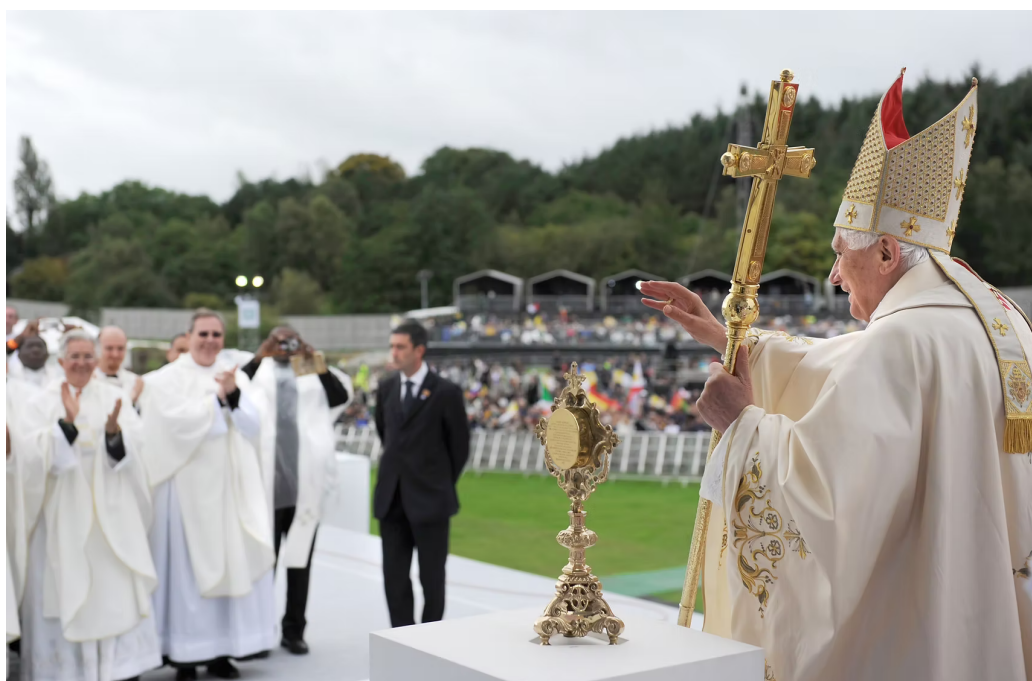
El Santo Padre Benedicto XVI, en un momento durante la Ceremonia de Beatificación del Cardenal John Henry Newman, Cofton Park de Rednal - Birmingham (19 de septiembre de 2010).

“soy un eslabón en una cadena, un vínculo de unión entre personas. No me ha creado para la nada. Haré el bien, haré su trabajo; seré un ángel de paz, un predicador de la verdad en el lugar que me es propio... si lo hago, me mantendré en sus mandamientos y le serviré a Él en mis quehaceres” (Meditaciones y devociones, 301-2).