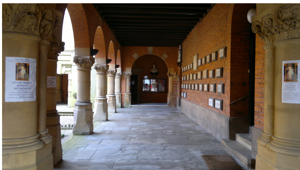
Memorial dedicado a John Henry Newman en el Oratorio de Birmingham

perfecta conformidad con cualquier otro aspecto de la Ley de Dios. Se adquiere tras una larga práctica; llegará al final. El cristiano moribundo cumplirá el papel del hijo pródigo con más exactitud que lo hizo nunca. Cuando volvemos a Dios por primera vez en nuestra vida, nuestro arrepentimiento se mezcla con todo tipo de visiones y sentimientos imperfectos. Desde luego, algo hay en él del verdadero carácter del puro sometimiento; pero el deseo de apaciguar a Dios, por un lado, y la dureza de corazón hacia nuestros pecados, por el otro, el mero miedo egoísta al castigo, o la esperanza de obtener un perdón fácil y rápido, estas y otras ideas parecidas, hacen mella en nosotros –no importa lo que digamos o creamos sentir–. Es fácil que se nos llene la boca de buenas obras o que la sensibilidad se excite; es fácil proclamar la completa renuncia a uno mismo unida a un