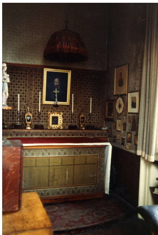
Biblioteca y Oratorio dedicado a San Felipe Neri, dentro de las habitaciones de Newman en el oratorio de Birmingham.