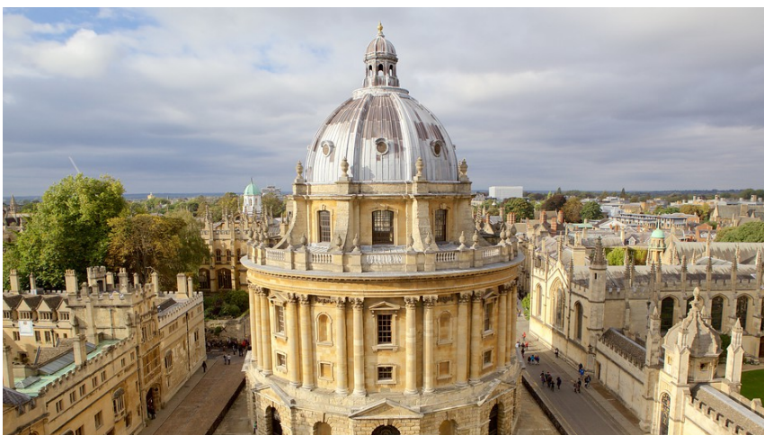
Distintas perspectivas de la Iglesia Universitaria de St. Mary, Oxford. Newman fue responsable de esta iglesia entre 1828 y 1843.