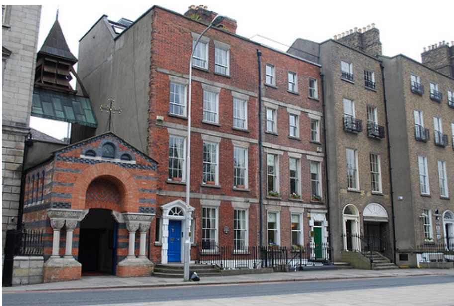
Newman house, en St.Stephen's Green South, 85-86. Primera sede de la Universidad Católica de Dublin. El mismo Newman adquirió y dirigió las obras para acondicionar estas instalaciones para la primera Universidad Católica de Irlanda, de la que él fue primer Rector (1854-1858).

había varios modos de "satisfacer" las obligaciones de la ordenación, de las cuales el trabajo como Tutor de un College era uno de ellos 25 .