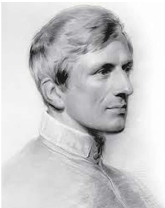
Newman, retrato estilizado del original de Richmond, Chalk, 1844.