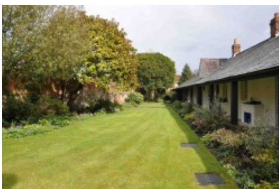
Dos vistas de Littlemore (Maryvale) donde vivió Newman los años previos a su conversión al catolicismo en 1845.