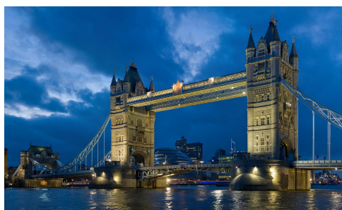
Dos vistas de Londres desde el Río Támesis: El Big Ben, en el lado noreste del Palacio de Westminster, actual sede del Parlamento (izq.), y Tower Bridge de Londres