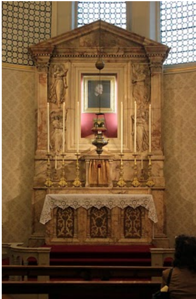
Capilla dedicada a al Beato John Henry Newman, dentro de la Iglesia del Oratorio de San Felipe Neri, Birmingham.

“Hoy, mientras es hoy, no endurezcáis vuestros corazones” (Hb 3, 7-8).