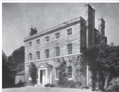
De arriba a abajo: Residencia de la Familia en 17 Southampton Place; fotografía de Holland House (Paul Fourdrinier); Grey Court House, Ham.